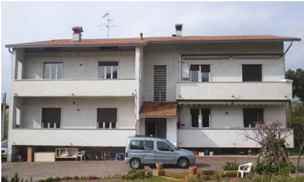
La palazzina prima e dopo l'intervento

Per raggiungere questo scopo la soluzione ottimale è stata identificata nella realizzazione di una facciata ventilata con ISOTEC PARETE , il sistema termoisolante studiato appositamente per questa applicazione, che