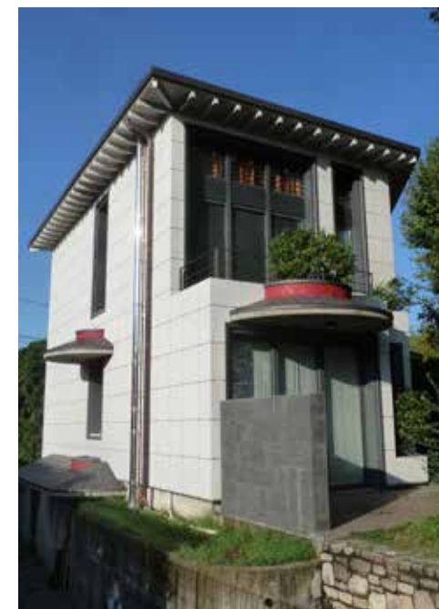
Dopo l'intervento di riqualificazione e ristrutturazione delle facciate