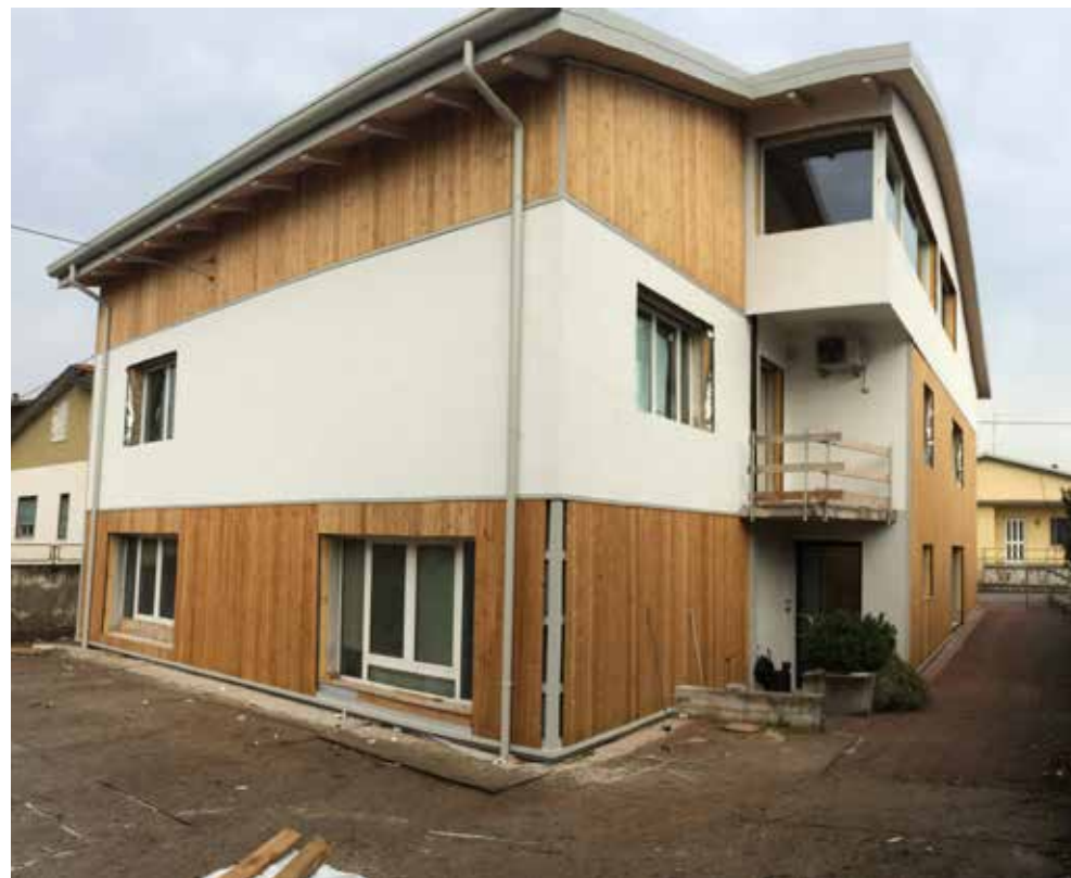
Prima e dopo l'intervento

Il progetto riguarda la ristrutturazione, con ricavo di un sottotetto, di un fabbricato adibito ad uffici costruito nei primi anni '70, situato a Villafranca di Verona. Come nel rifacimento della copertura, eseguita con camera di ventilazione, anche nella riqualificazione dell'involucro edilizio , lo studio di progettazione ha deciso di scegliere la soluzione tecnica della parete ventilata , anziché quella di un cappotto tradizionale per massimizzare le prestazioni di efficienza energetica dell'involucro , soprattutto migliorandone il comportamento durante il periodo estivo, con un sistema facile e rapido da posare.