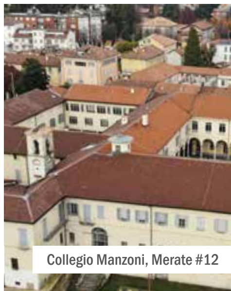
Collegio Manzoni, Merate #12