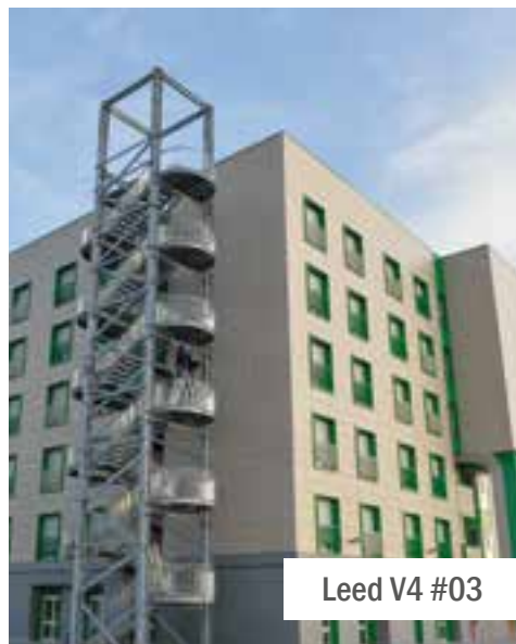
Leed V4 #03