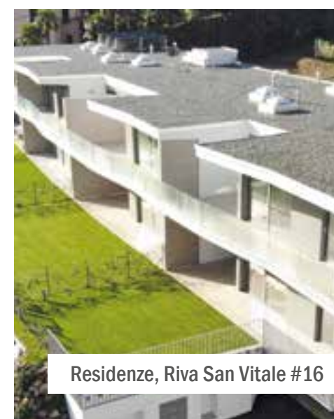
Residenze, Riva San Vitale #16