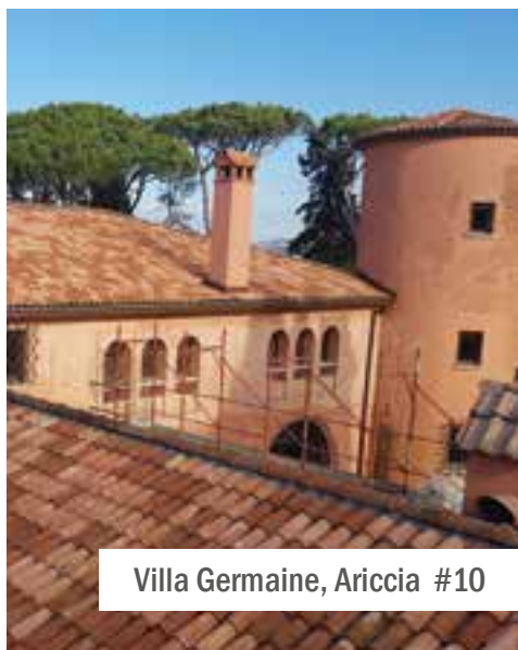
Villa Germaine, Ariccia #10